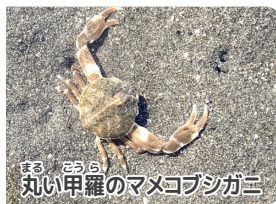
丸い甲羅のマメコブシガニ

には「三番瀬 鳥と海の生きものアートフェスティバル2026」を開催します。鳥や海の生きものをテーマにしたアート作品の展示や販売はもちろん、干潟での生きもの観察やバードウォッチング、アート教室、写真展なども開催します。生きものとアートに浸る2日間! ぜひ春の三番瀬に遊びに来てください。(野口)