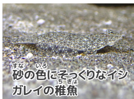
砂の色にそっくりなイシガレイの稚魚