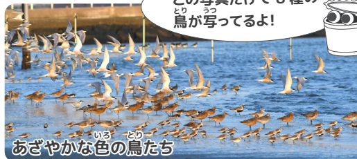
あざやかな色の鳥たち