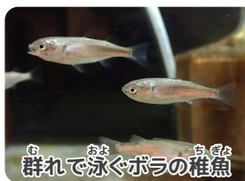
群れて泳ぐボラの稚魚

様々な生きものたちでにぎわう春は、生きもの観察にぴったりの季節です。そんな春は学習館もイベントが盛りだくさん! 5/9(土)と5/10(日)