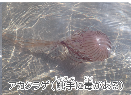
アカクラゲ(触手に毒がある)

りの開始時間が毎日変わってくるのです。風や気圧によって予測された潮位と実際の潮位が変わることもあります。予測よりも潮の引きがいい時には、早めに潮干狩りを始めることもあります。