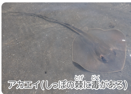
アカエイ(しっぽの棘に毒がある)

干潮・満潮は、海面の高さだけでなく時間も日によって変わってきます。潮の干満の時間は、月と太陽の影響で毎日平均50分くらいずつ遅くなっていきます。そのため潮干狩